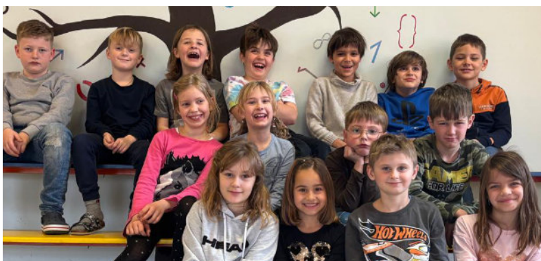
...15 Kinder in Pöls am 25.Mai