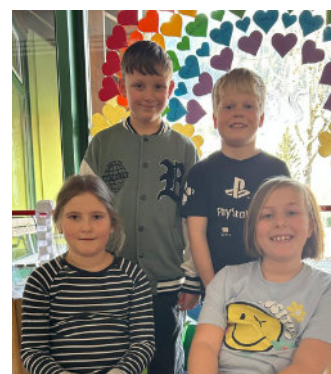
...4 Kinder in Pusterwald am 9. Juni