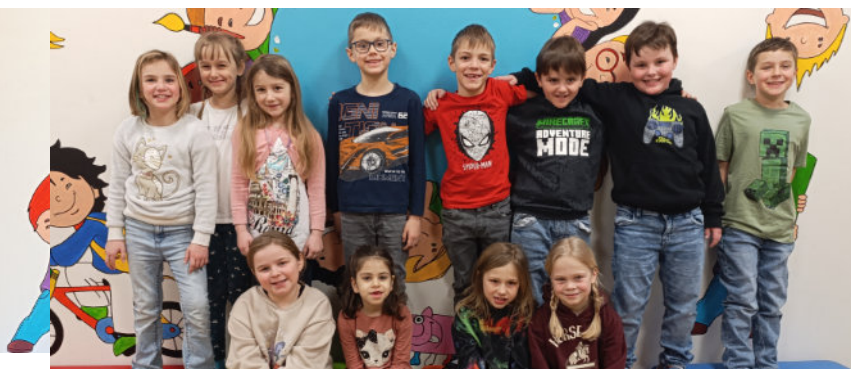
... 12 Kinder in St. Oswald am 29.Mai