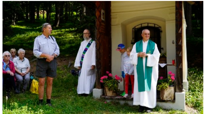
Christophorusmesse am 29. Juli