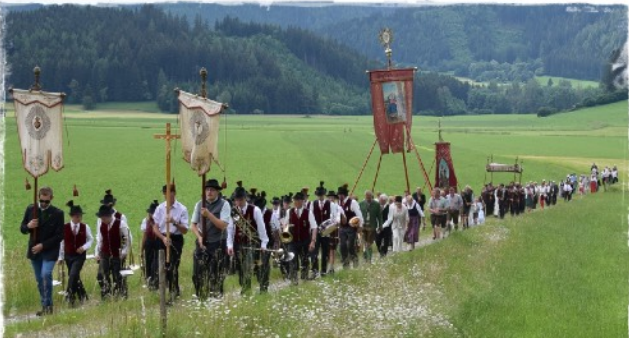
Bergmesse bei der Loretto-Kapelle