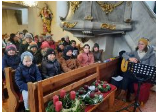
Adventkranzsegnung und Hl. Messe am 8. Dezember