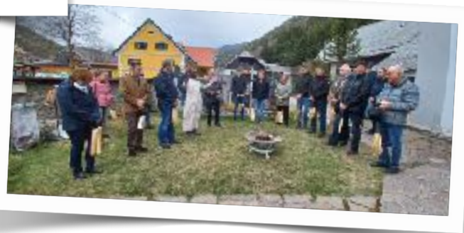
Osterspeisensegnung mit Scheitelweihe